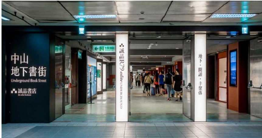
往誠品 R79 地下書街方向前行

從紅線出站，出站後左轉，往誠品 R79 地下書街方向前行，一直走約 300 公尺看到星巴克時，往前方的電扶梯上樓，會看到右方一片綠色草皮，捷韻國際廳就在便利商店隔壁。