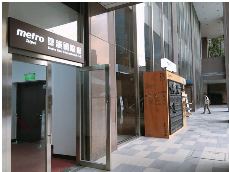
星巴克前方的電扶梯上樓 就會看到捷韻廳/萊爾富便利商店隔壁